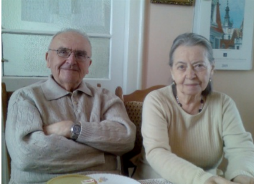
Soții Rothenstein în februarie 2009

Avea soluții inedite la cele mai diverse probleme, nu în mod necesar legate de fizică. De pildă, îngrijorat fiind că soția lui va fi singură în perioada în care el era la spital, a cazat la el acasă o femeie, necunoscută, care ținea companie unui alt bolnav din salon. Aceasta a fost să fie ultima din marile lui idei.