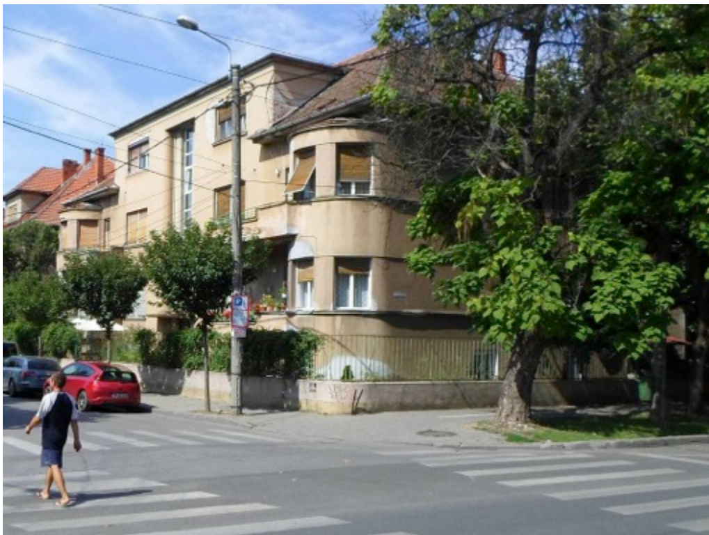
Vilă modernistă, str. Michelangelo Timișoara (vis-a-vis de Parcul