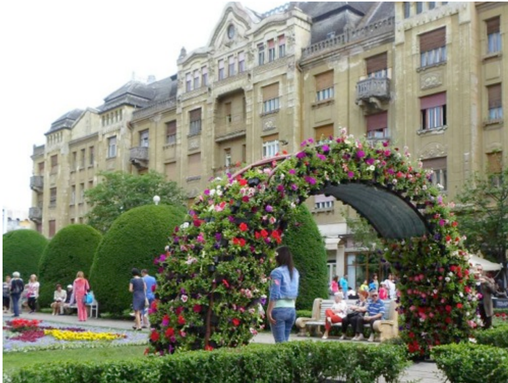
Palatul Löffler în Piața Operei