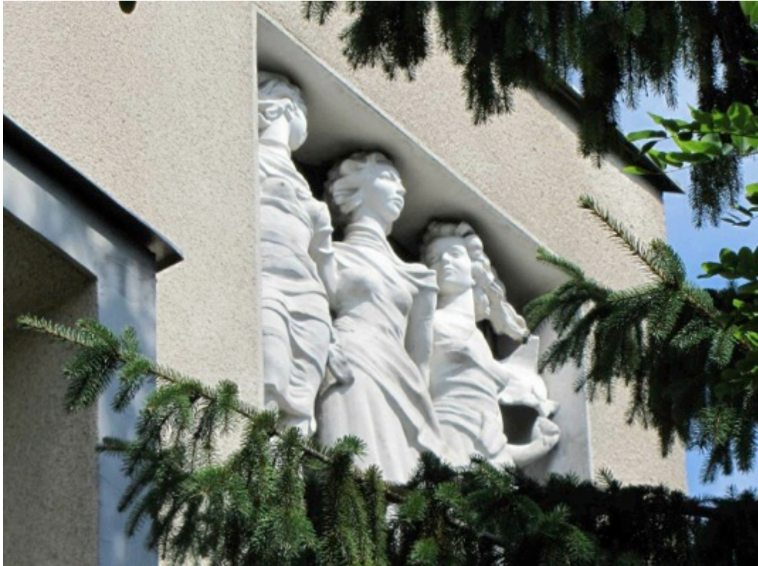
Casa cu Trei Fete, Timișoara