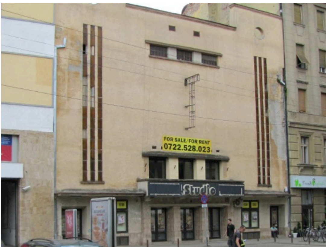
Clădirea Cinema Studio Timișoara, str. Lenau.