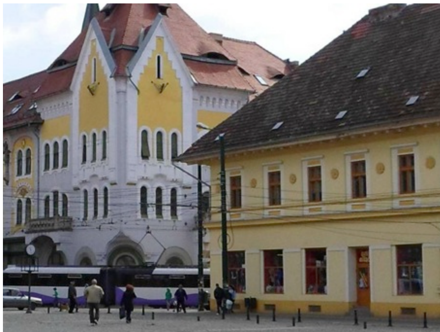
Palatul Tótsiz (casa municipiului) din Piața Traian.