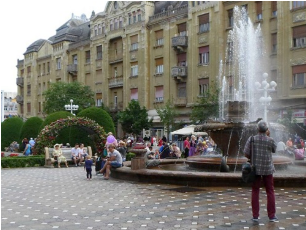
Palatul Löffler în Piața Operei