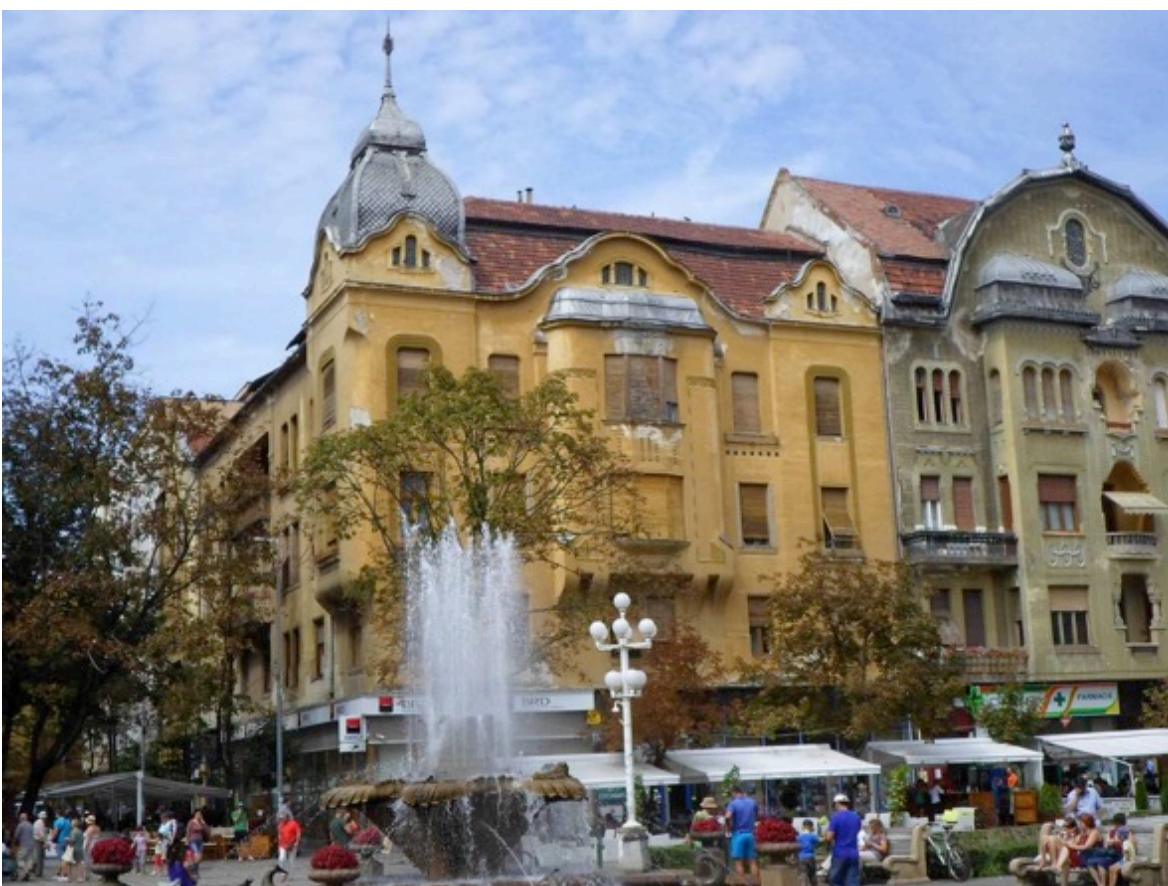
Palatul Merbl, Timișoara.

Palatul Merbl ( https://de.wikipedia.org/wiki/Palais_Merbl ) a fost construit în 1911 de arhitectul Arnold Merbl in stil Sezession cu elemente baroc.