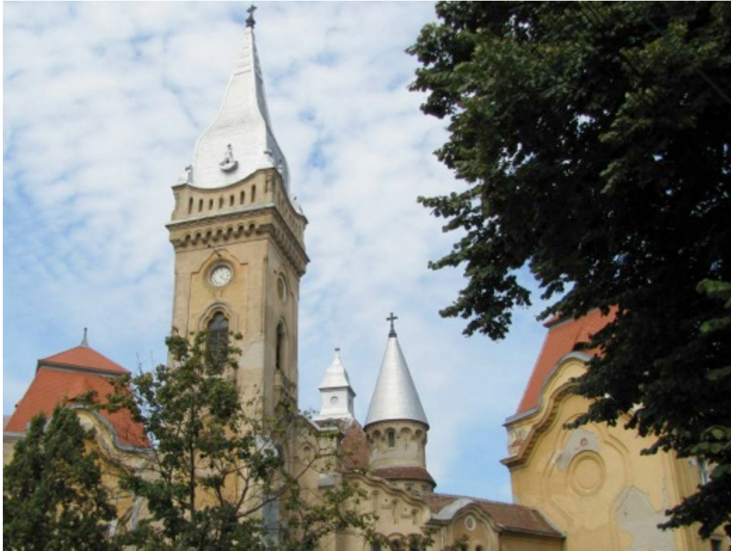
Biserica Piaristă Romano-Catolica Timișoara.