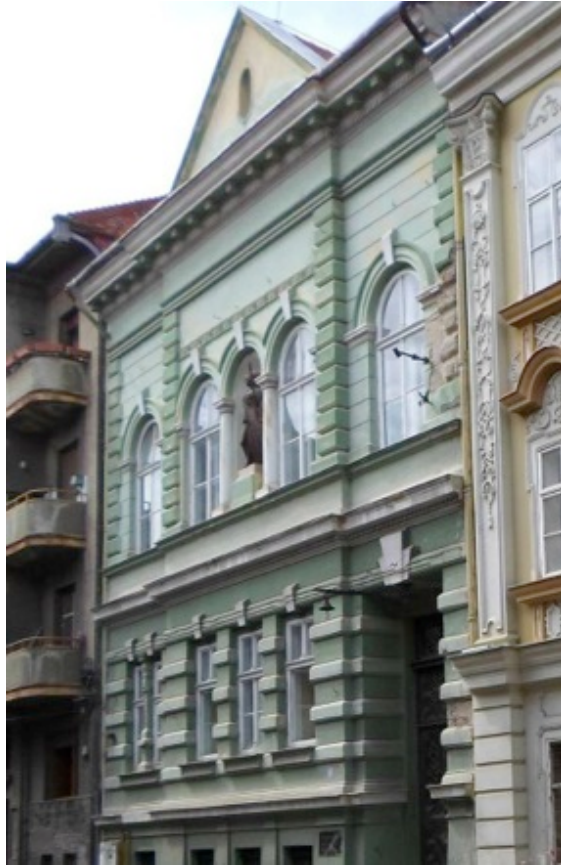
Biblioteca Academiei. Arh. Jakob Klein.