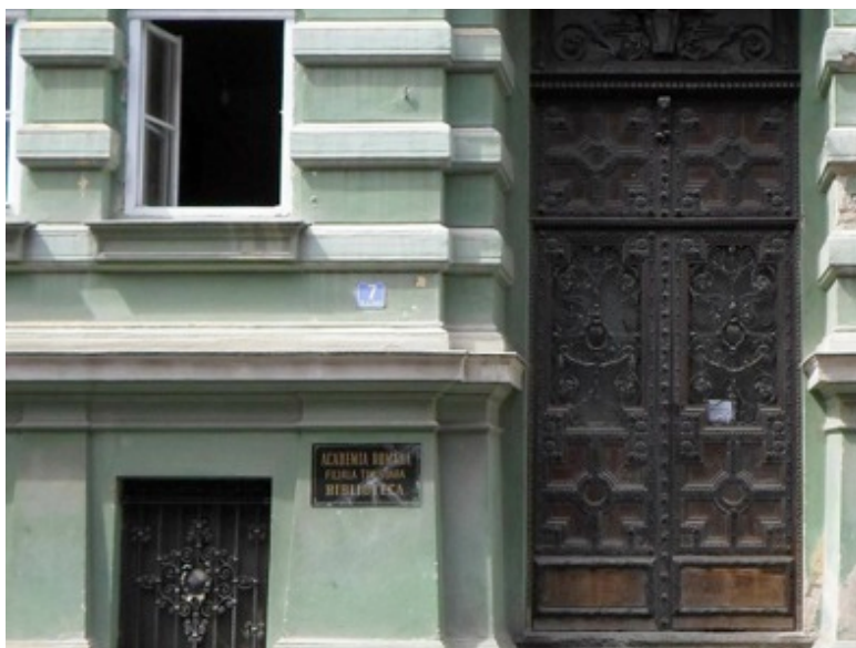
Biblioteca Academiei din Timișoara.