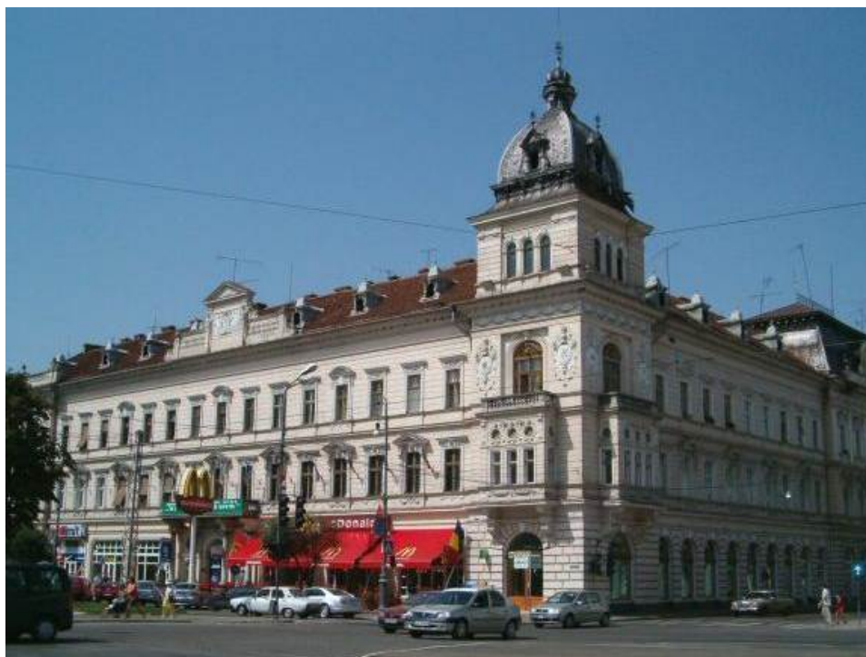
Palatul Neumann – Arad

Palatul Neumann la Arad a fost construit de cel mai mare industriaș din zona aceasta a Europei, baronul Neumann. Clădirea se află vis-a-vis de primărie. Familia Neumann a avut inițial o fabrică de spirt în anii 1860, când familia s-a mutat din Cehia și mai târziu a creat fabrica de textile UTA din Arad.