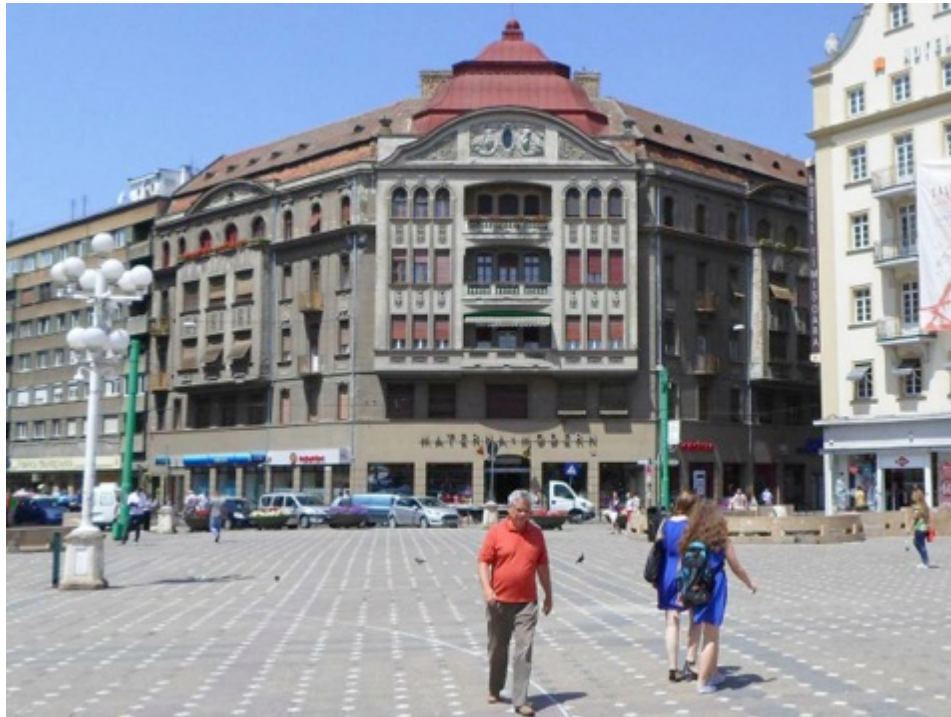
Palatul Weiss Timișoara.