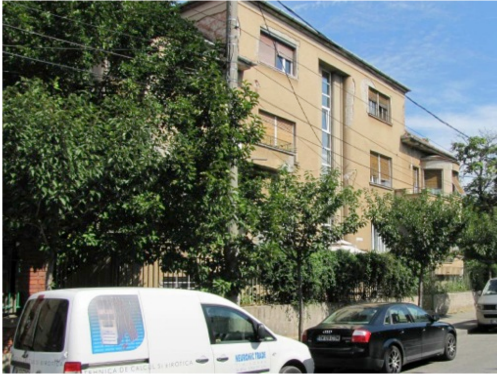
Vilă modernistă, str. Michelangelo, Timișoara (vis-a-vis de Parcul Rozelor).