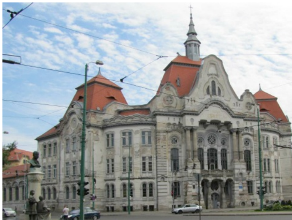
Liceul Piarist Timișoara.