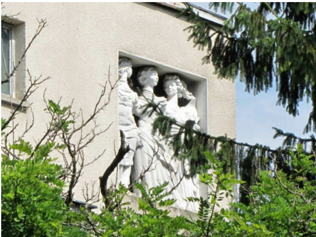
Casa cu Trei Fete Timișoara. Foto: Costică Liciu