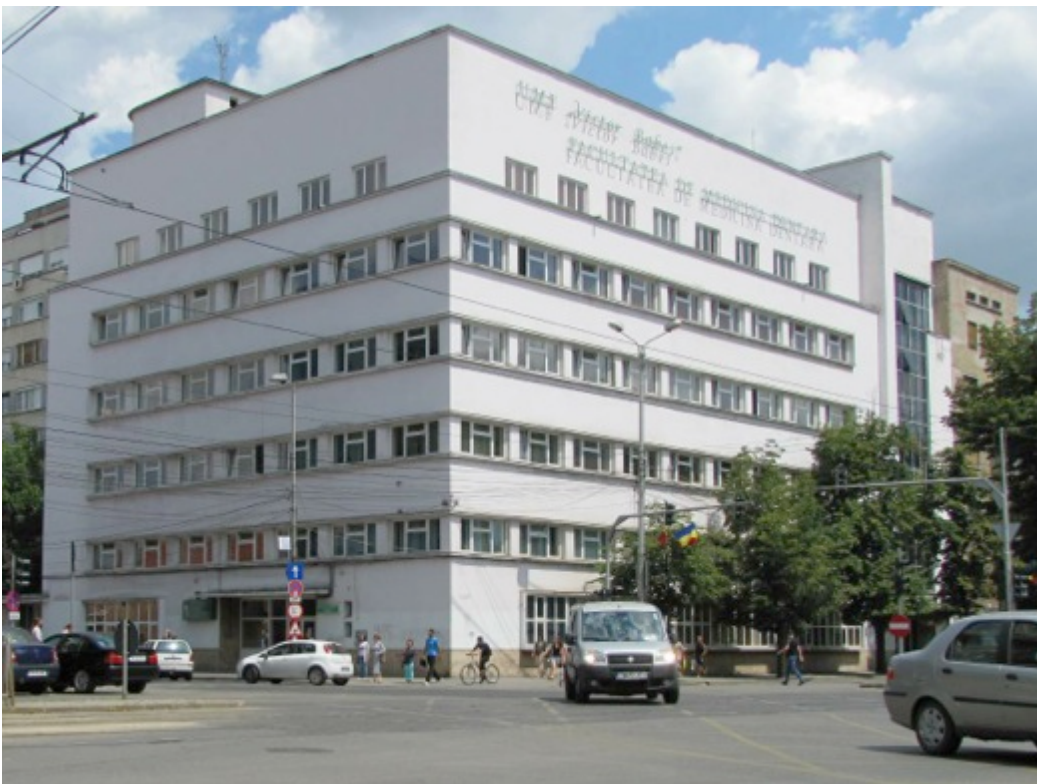
Facultatea de Stomatologie din Timișoara.