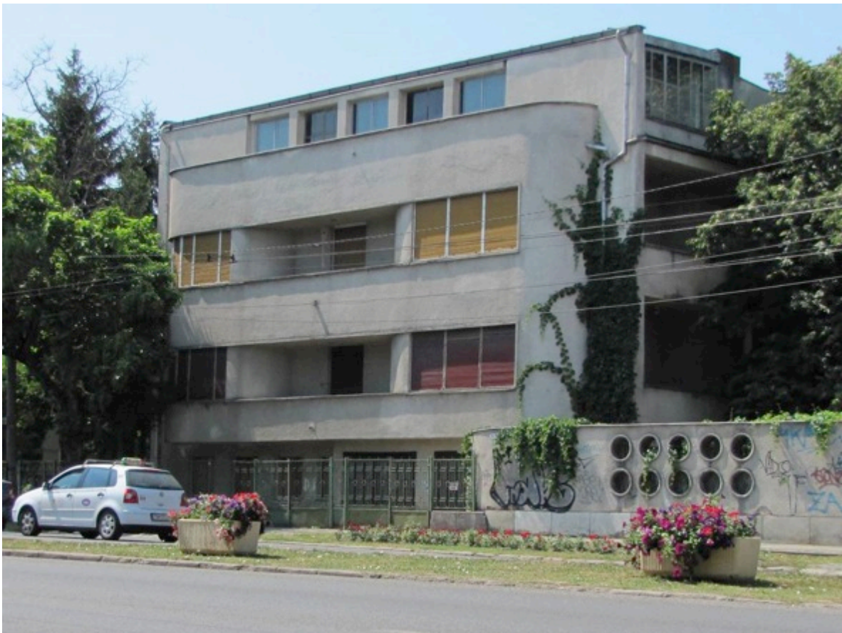
Casa cu Trei Fete, Timișoara.