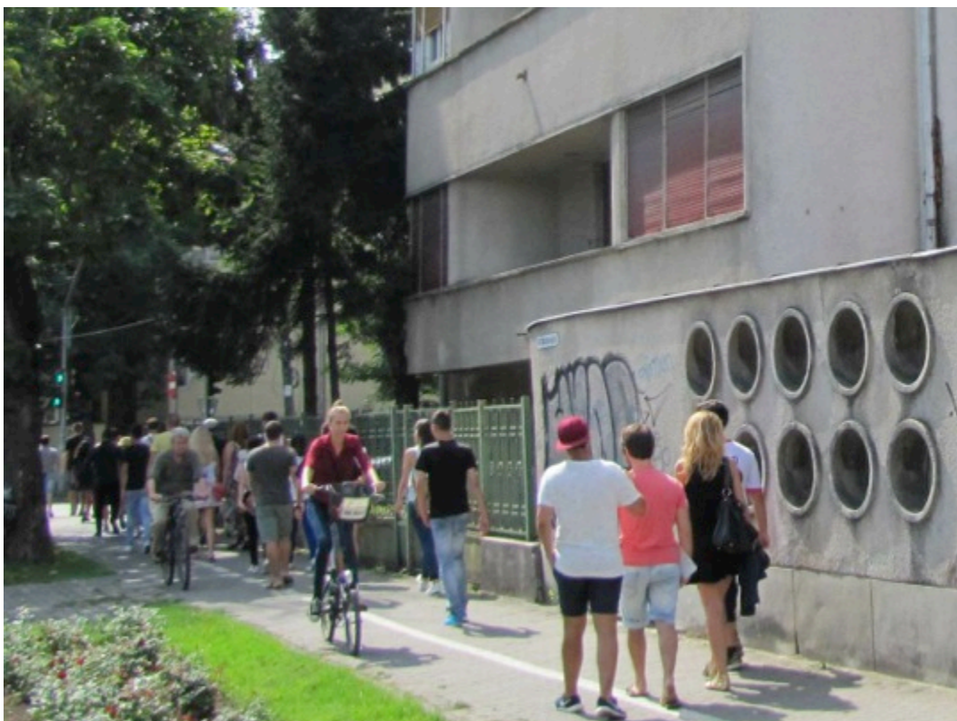
Casa cu Trei Fete, Timișoara. Foto: Costică Liciu