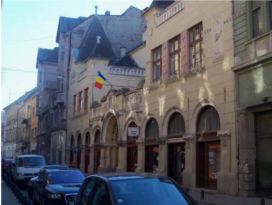
Școala (cl. I-VIII) Țichindeal, Arad. Arh.: STEINER JOZSEF

Activitatea evreilor în domeniul construcțiilor a încetat la Timișoara și la Arad după al Doilea Război Mondial, odată cu instaurarea comunismului. Evreii au emigrat în anii ce au urmat în proporție de 98%. Clădirile create de ei există și astăzi într-o stare mai mult sau mai puțin avansată de degradare.