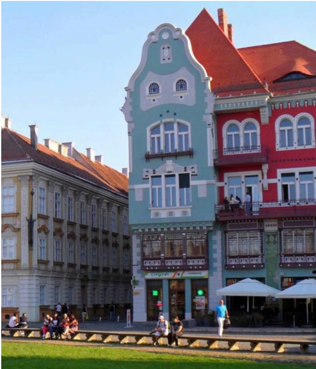
Casa Brück în Piața Unirii.