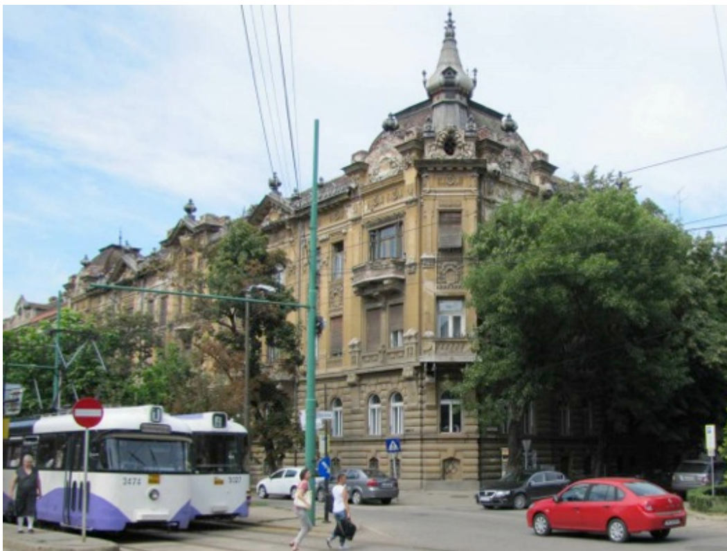
Palatul lui Steiner Miksa.