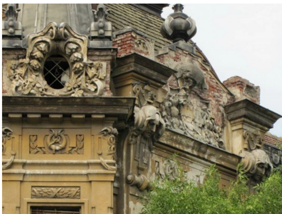
Palatul lui Steiner Miksa (detaliu).