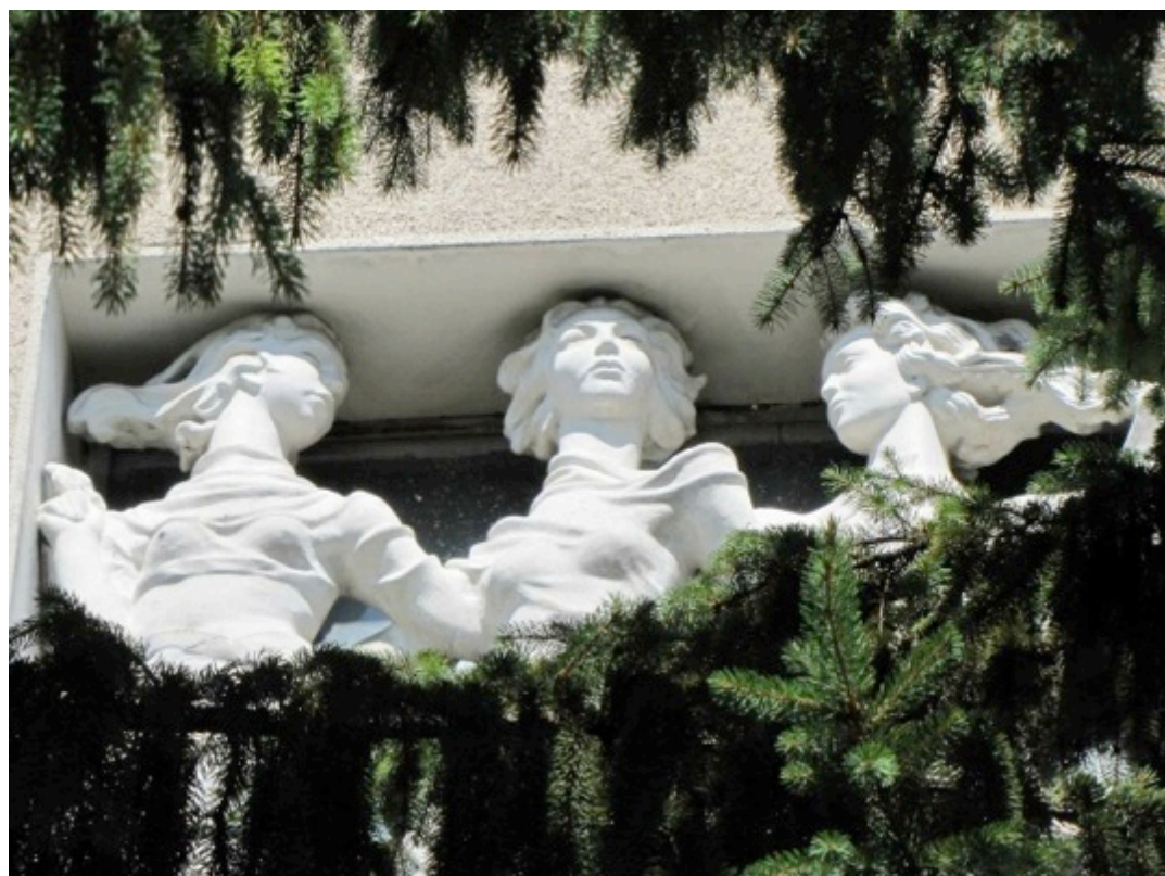
Casa cu Trei Fete, Timișoara