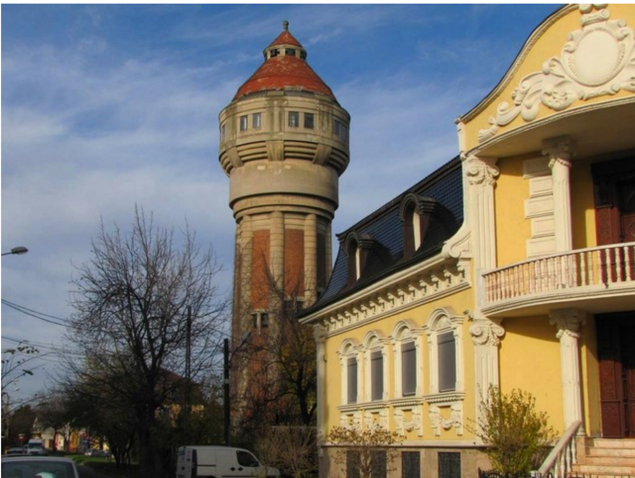
Turnul de Apă din Cartierul Fabric – str. Samuil Micu Timișoara

Azi, 18.11.2015, pun din nou bicicleta în mișcare, traversez Canalul Bega peste Podul de Fier. Pornesc pe Splaiul Nicolae Titulescu. Pedalez mai departe pe pista de biciclisti, trec pe langa fosta terasa de vara "VAPORUL", trec pe sub Podul Traian... ajung la Podul Mihai Viteazul din Cartierul Fabric. Pe str. Samuil Micu ma întâmpină Turnul de Apa. Fac la dreapta pe str. Lorena, ajung la linia tramvaielor 1 și 2 de pe str. Gheorghe Adam.