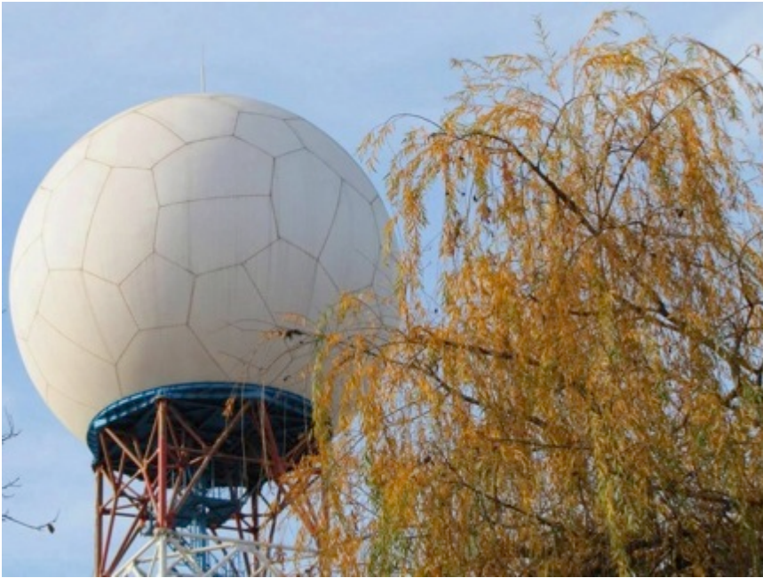
Stația Meteo Timișoara

Ajung la bariera de cale ferata care face legatura între Stația C. F. Timișoara Nord și Stația C. F. București Nord.