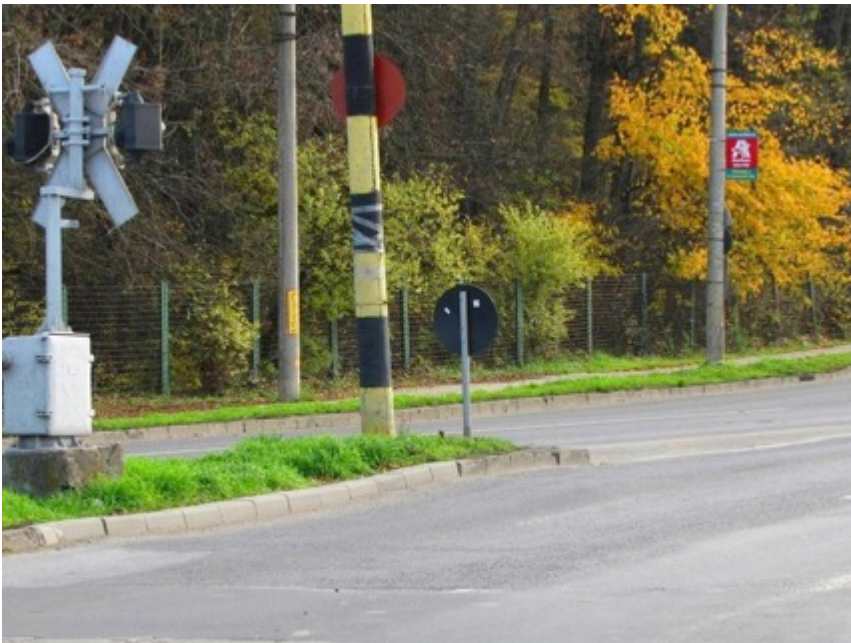
Bariera de cale ferată din apropierea Stației Meteo Timișoara

Ajung la bariera de cale ferata care face legatura între Stația C. F. Timișoara Nord și Stația C. F. București Nord.