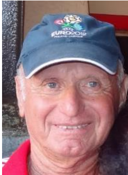
Abraham Klein, 2014

Arbitru internațional de fotbal FIFA între 1965 - 1982