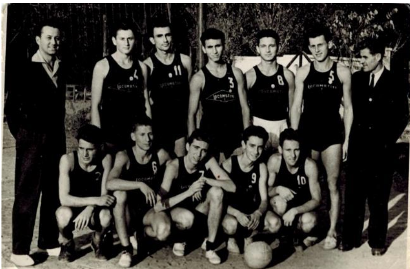
Echipa de volei Timișoara