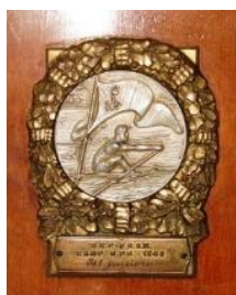
Medalia de campion national, canotaj 8+1

Articol de dr. Gyuri Gerő http://www.bjt2006.org/Mens_sana.htm