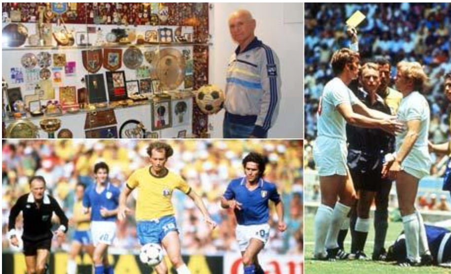
Colaj de fotografii din articolul "The Forgotten Story of ... Abraham Klein referee, the "master of the whistle" in The Guardian .