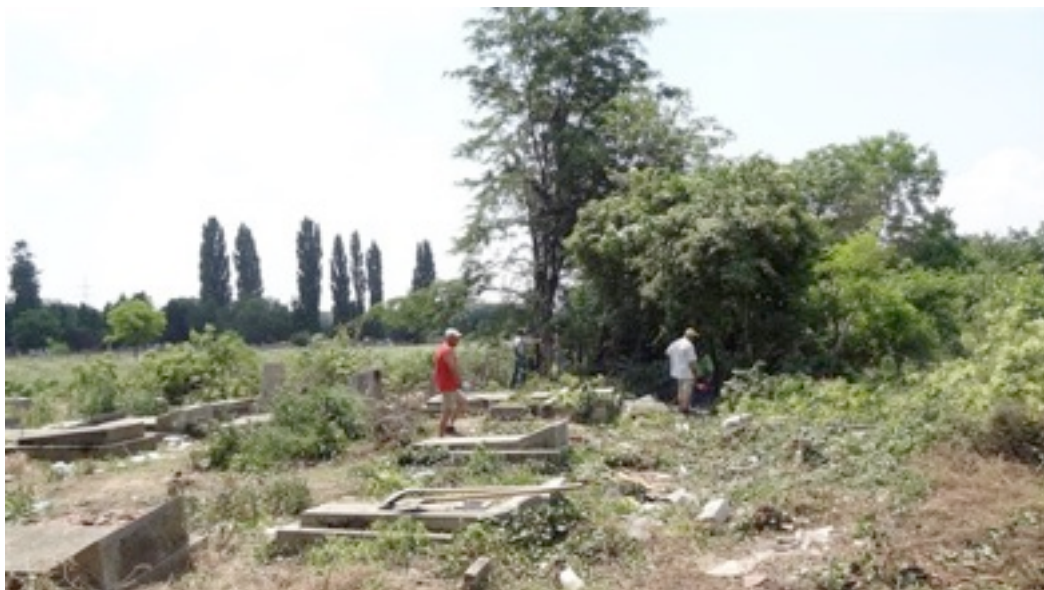
Se pregătește terenul pentru instalarea gardului.