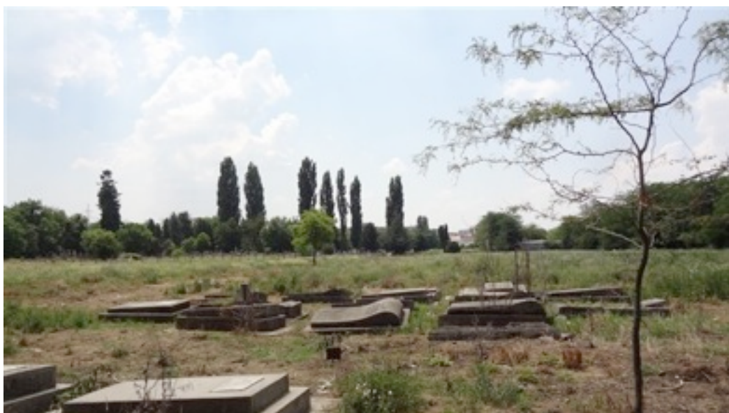
Privire dinspre "Palestina" spre cimitirul propriu-zis.

În ce privește digitalizarea registrului cimitirului, mai mult de 10.000 de nume din cele 13.000 au fost introduse într-un tabel Excel. În maximum două luni, tabelul va fi complet și, în faza următoare, pus online de către dl ing. Ronny Wagmann.