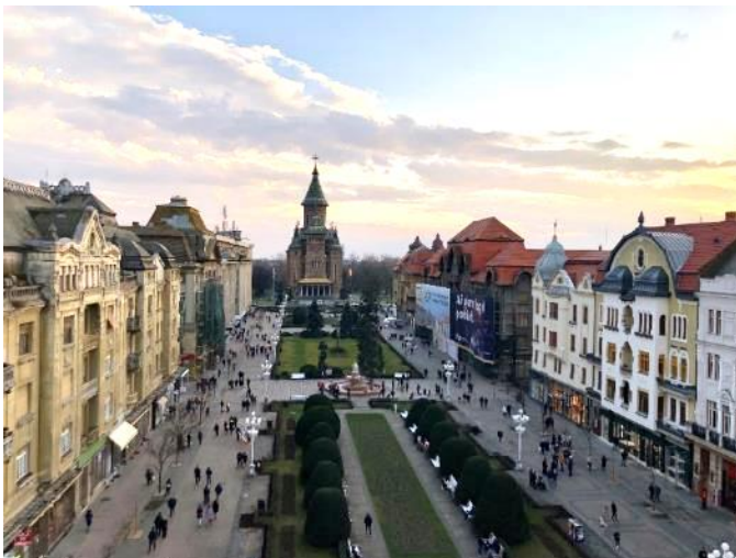
Vedere din Pepinieră