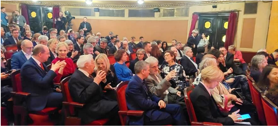
Publicul la festivitatea de deschidere