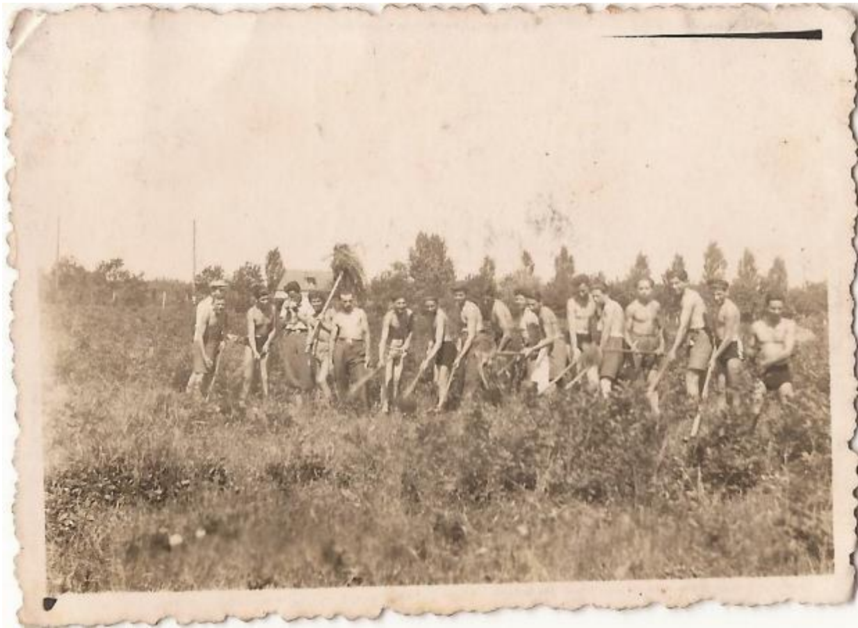
Pe verso: Munkaszolgálat a Pepinieraba Junius 1943 VI (Muncă obligatorie în Pepinieră. Plantare arbori. Iunie 1943)