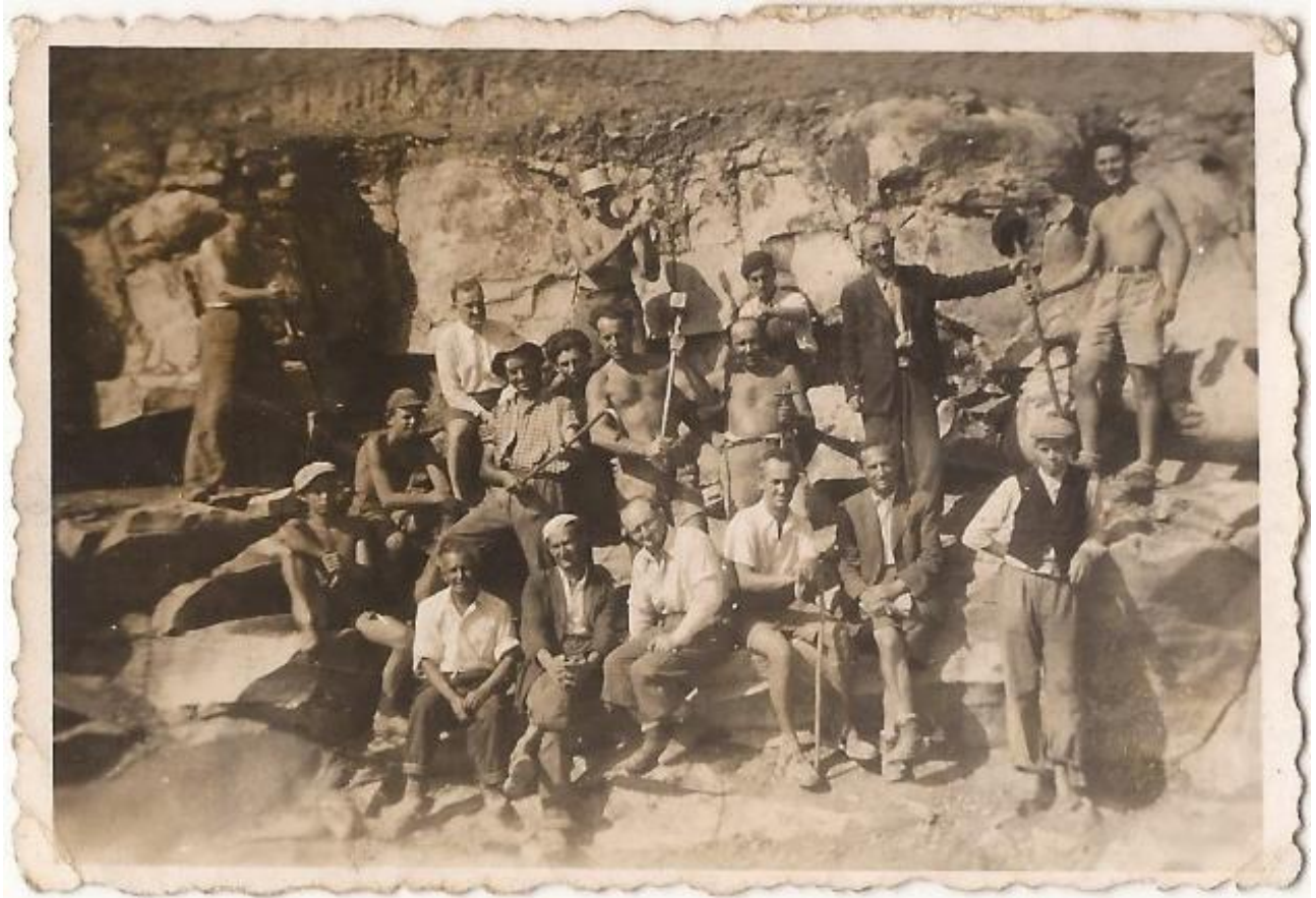
Pe verso: Kőbánya Cariera de piatră Lucareț 1944