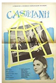
Afișele filmelor "Portretul unui necunoscut" și "Castelanii"