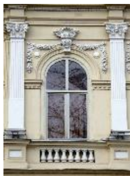
Facultatea de Chimie Industrială (detaliu)