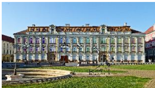
Muzeul de Artă Timișoara