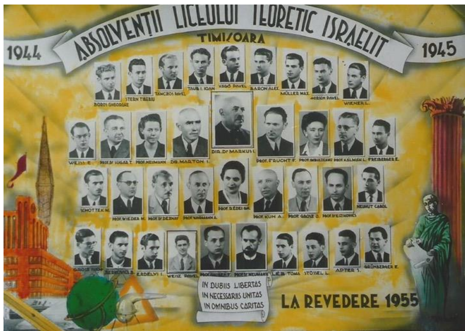
Tabloul de absolvenți al Liceului Teoretic Israelit din Timișoara 1944/1945

Pe 10 februarie 2010 a fost înmormântat la cimitirul evreilor din Óbuda.