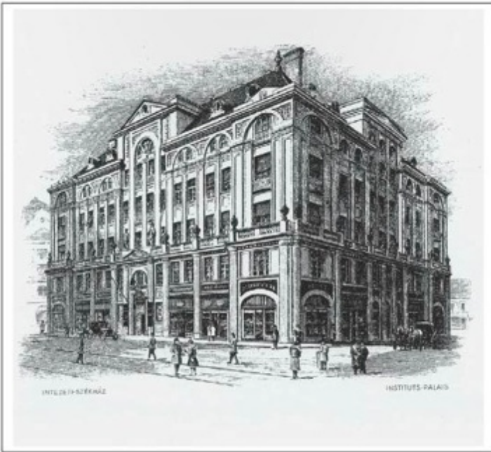
Instituts-Palais, auch Szana-Palais genannt, erbaut 1920-1922.