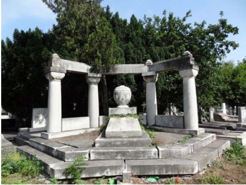
Monumentul funerar în Cimitirul Evreilor Timișoara