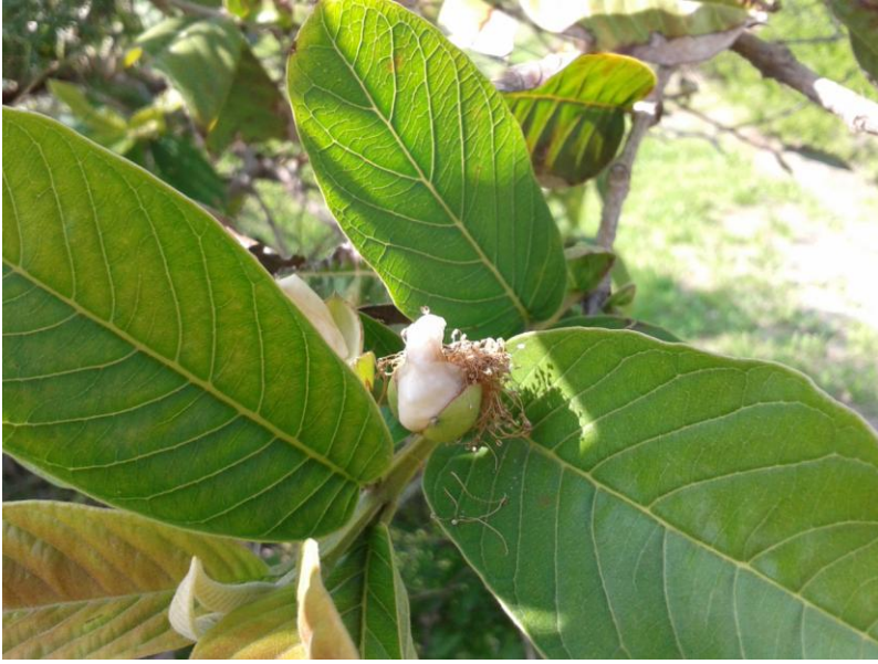
smochinul dadea frunzulite noi: