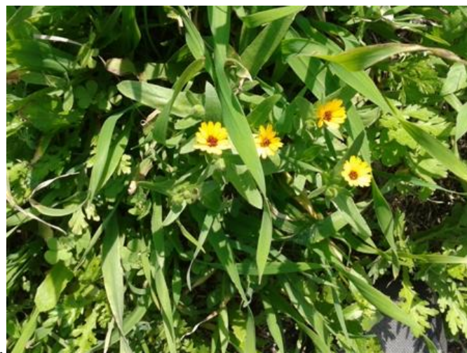
Totul mustea de viata, de apa, culoarea ne orbea.