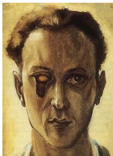
Victor Brauner, Portret