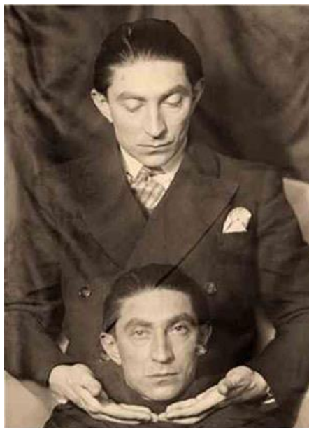
Benjamin Fondane (Killed by History)