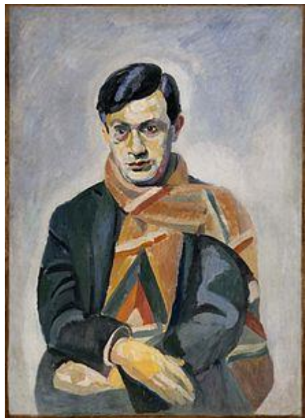
Robert Delaunay, Tristan Tzara