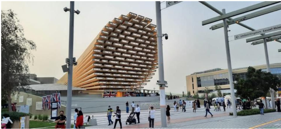
Expo 2020 Dubai

În orașul vechi Dubai am vizitat muzeele arheologice, muzeul islamic, muzeul condimentelor și — o surpriză emoționantă — un muzeu privat despre răscrucea civilizațiilor, organizat de Ahmed al Mansuri, un șeic iubitor de cultură și colecționar de documente și obiecte istorice, membru al Consiliului național al Emiratelor. Spirit deschis și nonconformist, a organizat în acest muzeu încă în 2012, galerii închinată islamului, creștinismului și iudaismului, un muzeu al perlelor, iar anul trecut — o premieră în lumea arabă — cu ajutorul unei tinere asistente israeliene dintr-o familie de origine yemenită, o secție în amintirea Holocaustului, cu exponate achiziționate în lume despre distrugerea unor comunități evreiești, cum a fost cea din Hust, în Maramureșul rutean sau ucrainian, sau cea din Viena, precum și despre comunitățile din trecut din țările arabe. Am văzut și o scrisoare a lui Theodor Herzl, și o fotografie privată a lui Itzhak Rabin.