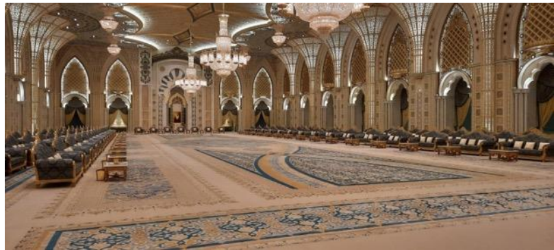
Sala de recepții la Palatul Națiunii din Abu Dhabi