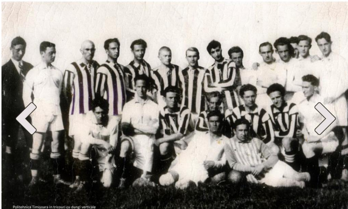
Politehnica Timișoara în tricouri cu dungi verticale