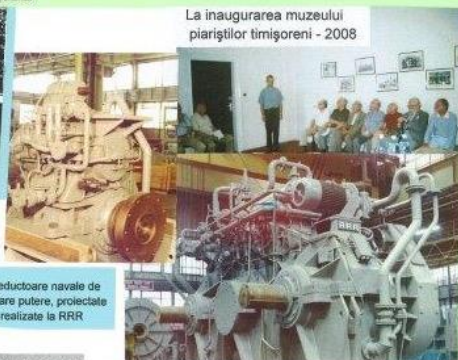
La inaugurarea muzeului piariștilor timișoreni - 2008