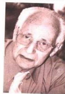
...după 65 de ani

Colectivul proiectanților care a adaptat motorul Diesel pentru funcționare în zone aride tropicale