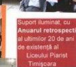
Sprijin iluminat, cu Anuarul retrospectiv al ultimilor 20 de ani de existență al Liceului Piarist Timișoara