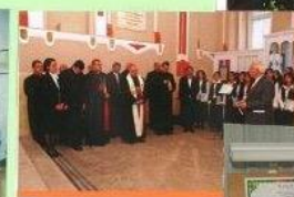
Cu ocazia Centenarului clădirii Liceului Piarist din Timișoara a fost onorat, să felicite auditoriul în numele elevilor de odinioară