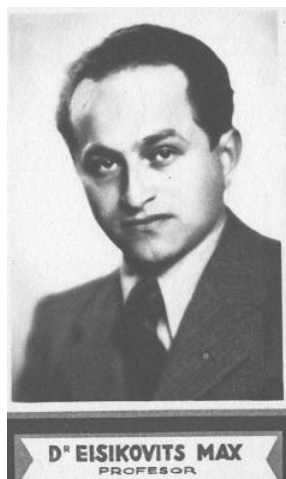
Tabloul absolvenților Liceului Israelit Timișoara