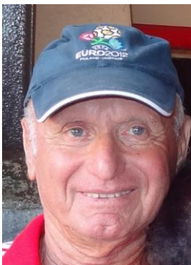
Abraham Klein, 2014

Arbitru internațional de fotbal FIFA între 1965 - 1982