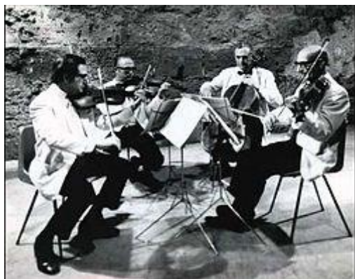
Noul Cvartet Israelian

(n. Deutel, 21 octombrie 1932 Timișoara – d.18 ianuarie 2005, Olanda) Violonist israelian și olandez, originar din România, concertmaistrul Ansamblului de cameră israelian, unul din fondatorii „Noului cvartet israelian”, care a activat în Israel în anii 1960-1970.