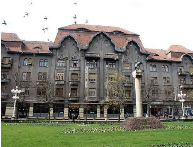
Palatul Dauerbach, proprietatea familiei Dornhelm