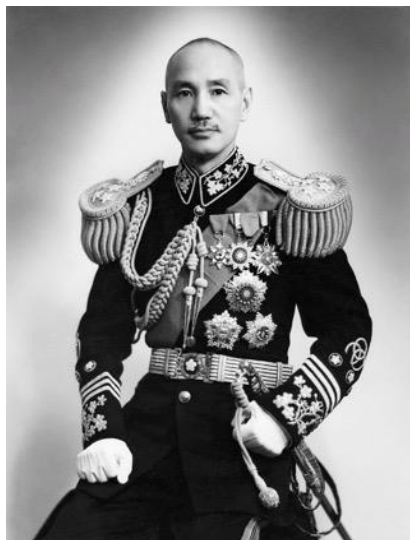
Chiang Kai Shek Wikipedia

Nanking și Hong Kong. Moişhe a reușit să-i scoată din China pe rudele lui Sun, dar el a rămas în China în serviciul lui Chiang Kai Shek.