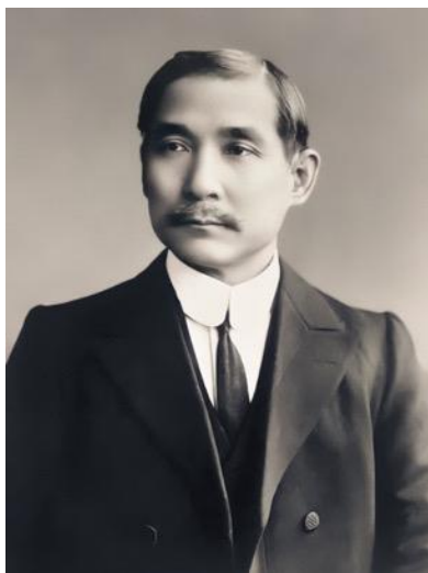
Dr. Sun Yat Sen