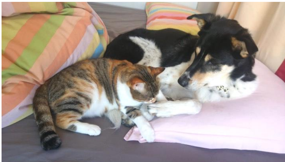
Nou veniți în familie: câinele Charlie și pisica oarbă Lilly