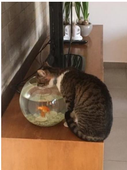
Pimpi și peștișorii