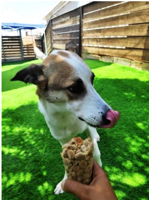
Kitty înfulecând o înghețată de crenvurști

Kitty este căteaua fiului nostru mezin, care a numit-o așa, pentru că are urechile ca de pisică. Kitty este foarte jucăușă și iubitoare și îi place mult să mănânce resturile de pui fierți de către soția mea. De când mezinul este cu prietena lui, i s-a alăturat lui Kitty și câinele Charlie și pisica oarbă Lilly care reușește să facă totul instinctiv, chiar dacă e oarbă din naștere. În zilele astea, mezinul se mută cu prietena, iar Kitty trece printr-o criză sufletească grea, trebuind să se despartă de Pluto , câinele vecinilor. Drept compensație, în zilele mutării, Kitty a fost luată la un pesion de câini unde au întâmpinat-o cu o înghețată de crenvurști.