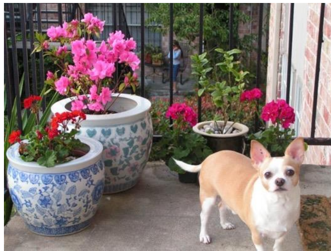
Bronco păzește casa

Cronologic vorbind, următorul câine pe care l-am cunoscut și l-am simpatizat a fost Bronco , cățelul de rasă chihuahua (există și o regiune cu același nume în Mexic), care aparținea unor prieteni de-ai noștri din România - Houston. Bronco era un tip nervos și lătra mult, fiindcă avea un puternic instinct de ași apăra teritoriul și pe stăpânii lui, dar când te cunoștea, simțea că te iubește. Deși traducerea cuvântului bronco în spaniolă înseamnă "dur, sălbatic", în realitate, Bronco era un cățel mic, care se speria ușor și putea fi drăgăstos, când simțea că este iubit. Acasă, Bronco era obișnuit să urineze în scutece și era foarte iubit de stăpânii săi. Bronco a trăit 13 ani și șapte luni.