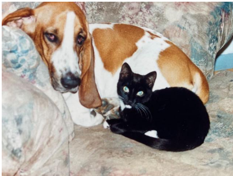
Goody și Joe

Goody avea întotdeauna o privire de melancolie blegoasă, căci avea un competitor la cucerirea inimii stăpânului. Mă refer la cotoiul pe nume Oswald , care însă i-a cauzat stăpânului neplăceri, cel puțin de două ori: prima oară, când l-a urcat pe avion și o stewardesă l-a întrebat cum o cheamă pe pisică, iar la auzul numelui Oswald, stewardesa a albit, făcând imediat asociația cu ucigașul lui Kennedy, Lee Oswald. Al doilea incident s-a întâmplat la Houston după moartea tragică a lui Oswald, călcat de o mașină în fața casei. Era deja seara târziu, când prietenul meu s-a decis să-l îngroape în mod respectabil într-o grădină din fața casei. La un moment dat, a fost încolțit de doi polițiști, din ăia pe care îi vezi câteodată la TV, care mai întâi trag cu pistolul și numai după aia își cer scuze. Văzându-l pe prieten săpând, polițiștii l-au întrebat "Pe cine ai îngropat domnule?". "Pe Oswald", a replicat prietenul pe un ton glumeț, întinzându-și mâna spre buzunarul pantalonului după o batistă, ca să-și șteargă nădușelile. "Păzea!", zise polițaiul conștiincios, scoțând pistolul încărcat din toc, crezând că prietenul umblă în buzunare după un pistol. Dar din fericire, până la urmă totul s-a terminat fără vărsare de sânge, că altfel n-aș mai avea un prieten la New York. Lui Oswald l-a succedat Joe , cotoiul negru, care încerca tot timpul să abuzeze sexual de Goody, deși amândoi erau masculi. Goody a trăit 11 ani.