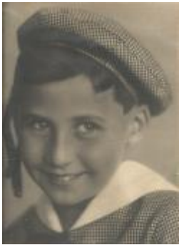
La vârsta de 8 ani

În anul 1932 am fost înscris la școala primară israelită din cartierul Iosefin, unde am învățat limba română, căci la noi acasă se vorbea ungurește, limba maternă a ambilor părinți. Nu-mi amintesc să fi avut vreo dificultate în învățatul limbii române și în scurt timp am înțeles tot și mi-am însușit tot ce s-a predat. Trebuie să menționez aici că majoritatea elevilor erau în aceeași situație, evreii din Banat având limba maternă maghiară. Dar nu țin minte să fi avut cineva dificultăți cu însușirea limbii române, ceea ce era esențial, căci era limba de predare oficială. Programul de învățământ era identic cu cel din școlile de stat, doar orele de religie erau specifice cultului mozaic și în plus se învăța alfabetul ebraic necesar pentru lectura rugăciunilor. Dar cum nu cunoșteam limba ebraică, citeam textele fără să le înțelegem, așa că participarea la serviciul divin era lipsită de conținut, deoarece nu înțelegeam despre ce e vorba. Doar la serile de seder cand tata ne dădea cărți de Hagada tipărite în două limbi, am început să înțeleg câte ceva din istoria noastră.