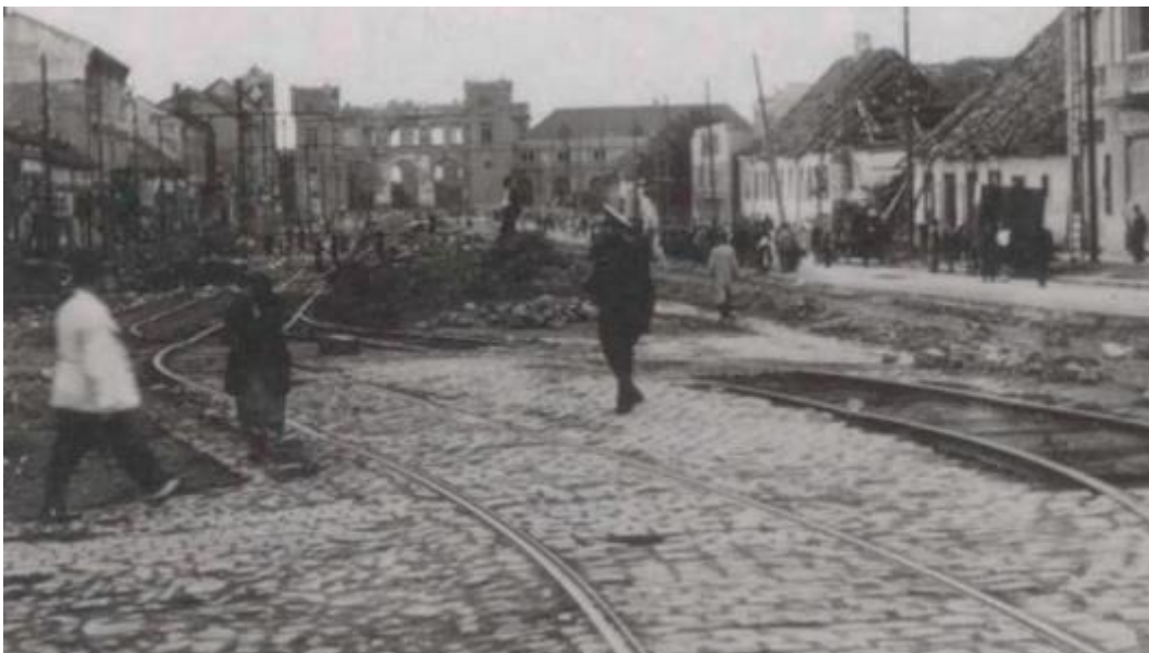
Str. Brătianu (str. Gării) Timișoara, după primul bombardament, iunie 1944. În partea din centru-dreapta se vede fațada clădirii Industria încă neatinsă.