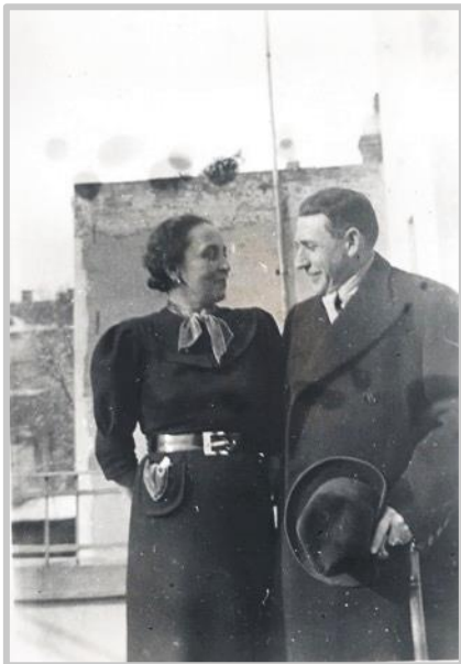
1940. Părinții mei pe terasa din str. Doja nr. 8.

Am practicat și alte sporturi, ca de exemplu patinaj – am avut și aici un accident provocat de o groapă care a apărut pe pista de gheață. Atunci am avut o fisură în braț pentru care am purtat ghips 6 săptămâni, dar am câștigat un prieten valoros, pe doctorul Naschitz care m-a introdus în tainele colecționarilor de timbre și care m-a învățat tehnologia celuloizului. El folosea celuloiz topit în acetonă în loc de ghips ceea ce i-a permis să ușureze mult viața celui ce trebuia să-l poarte.