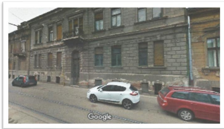
Casa de pe strada Doja nr. 8

Când am ajuns în clasa a patra, părinții mei au cumpărat o casă în strada Doja și ne-am mutat acolo. Dar cum distanța de acasă până la școala israelită era prea mare, am fost nevoit să mă mut la școala primară de stat din piața Lahovary.