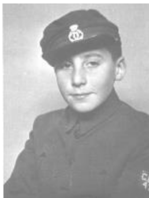
Elev la Liceul C. D. Loga

Și acum, înainte spre prima clasă de liceu! Tata a hotărât să mă înscrie la liceul de stat, Constantin Diaconovici Loga. Când l-am întrebat după mulți ani de ce m-a înscris acolo și nu la Liceul Piarist unde era fratele meu și nici la Liceul Israelit cum s-ar fi convenit pentru copilul unui “membru de frunte” al comunității, mi-a răspuns: “Ca să știi de pe acum că viața este grea!”